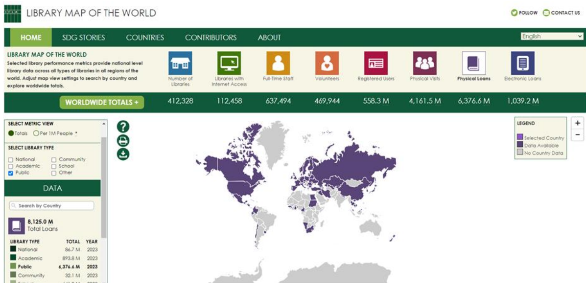
6 pav. IFLA statistika

Kvebeko viešųjų bibliotekų asociacijos (Kanada) projektas „Kvebeko viešųjų bibliotekų nacionalinis portretas“, šiek tiek primenantis 2014 m. Lietuvoje sudarytą bibliotekų reitingą pagal BIX metodiką, kurį vykdant bibliotekos vertinamos pagal 5 rodiklius (įsigijimui skirtos išlaidos, darbo valandos, tinkamas plotas, žmogiškieji ištekliai ir sėdimos vietos). Fondo sričiai čia aktualus rodiklis „(informacinių išteklių) įsigijimui skirtos išlaidos“, skaičiuojamas fondo atnaujinimo procentas , kurio rekomendacija siekia 9% (IFLA rekomendacija savivaldybių viešosioms bibliotekoms – 10%).