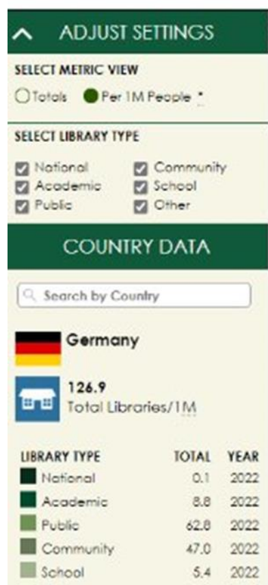
5 pav. IFLA statistikos pavyzdys

Žvelgiant į užsienio šalių bibliotekų bei įvairių asociacijų patirtį, galima pastebėti ryškesnį palyginamumo per išvestinius rodiklius dėsningumą. Pavyzdžiui, vienas iš Švedijos nacionalinės bibliotekos metinėje ataskaitoje aprašomų rodiklių yra darbuotojų, užsiimančių gyventojų mokymais, skaičius. IFLA pasaulio bibliotekų žemėlapyje ir statistikoje taip pat galima filtruoti duomenis tiek pagal realius skaičius, tiek pagal išvestinius (tam tikras rodiklis 1 milijonui gyventojų, žr. 5 pav.).