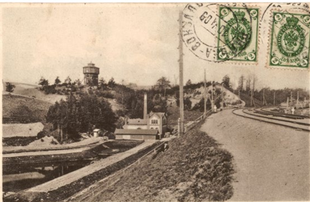
Вильно. Железнодорожный водопроводъ.