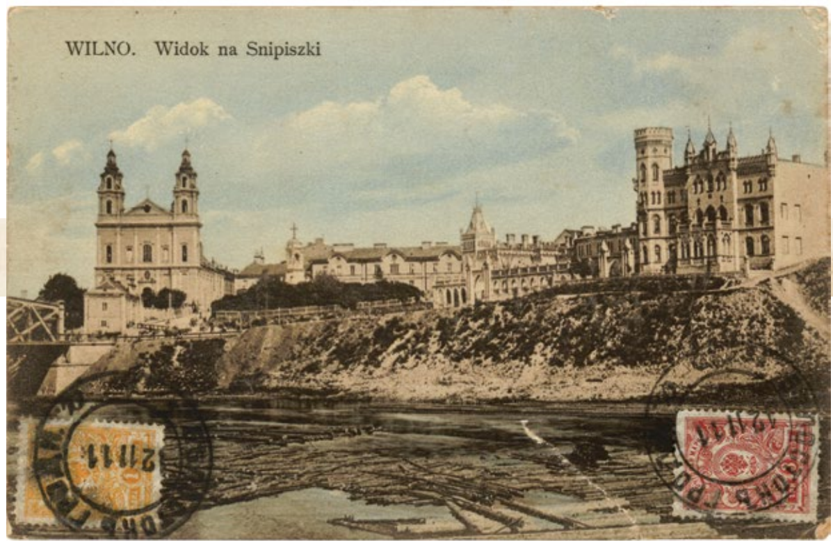
WILNO. Widok na Snipiszki