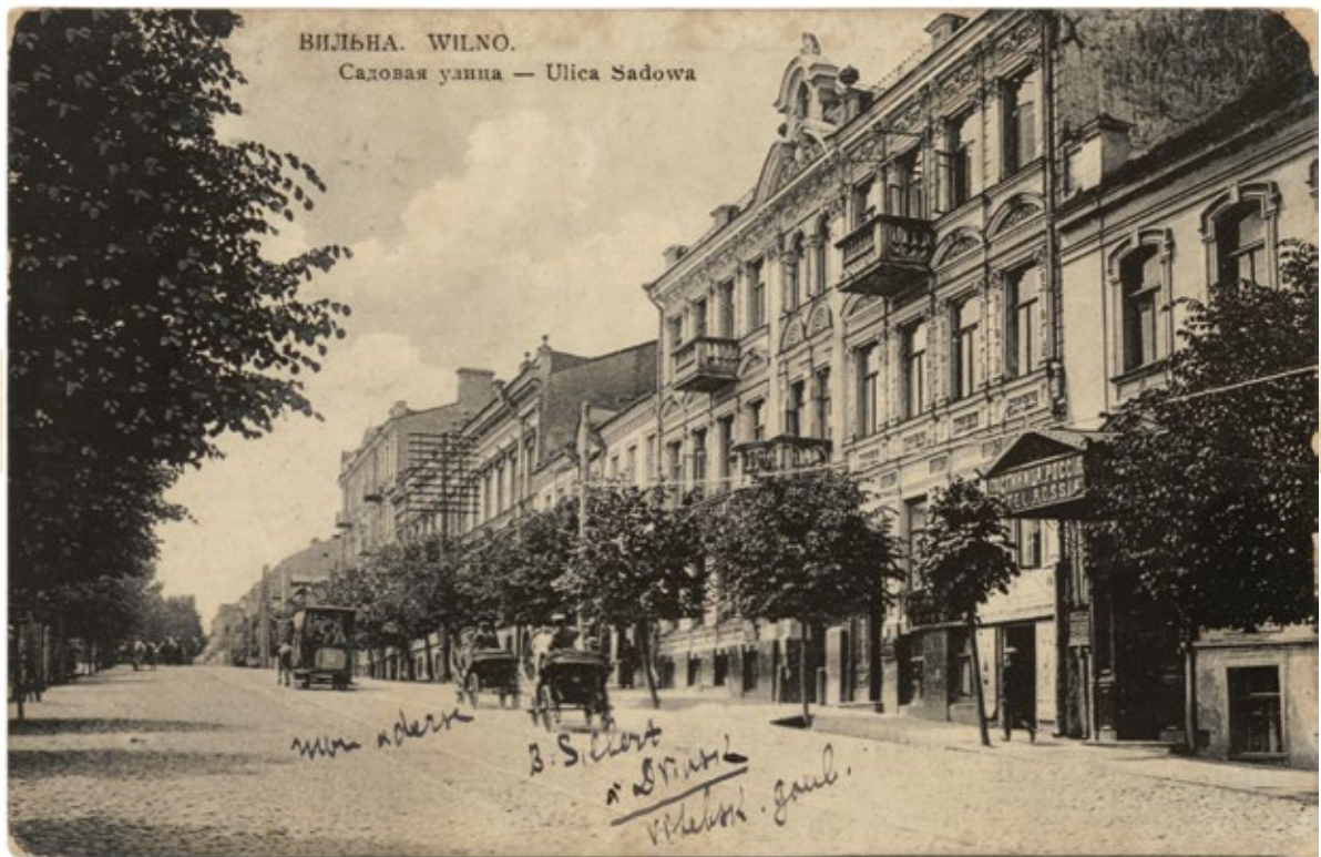
ВІЛЬНА. WILNO. Садовая улица — Ulica Sadowa