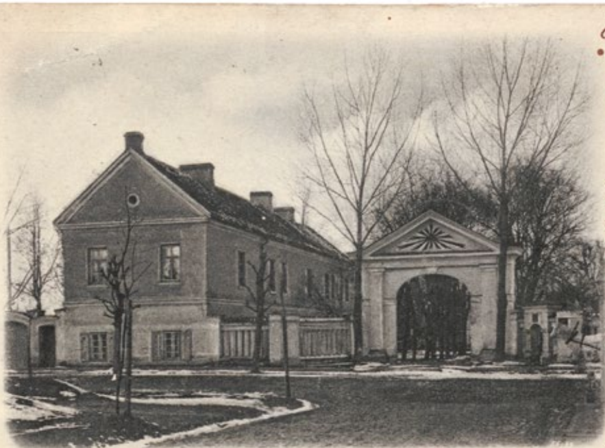
Waisenhaus der ev.-luth. Gemeinde zu Wilna